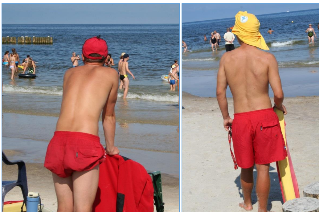
Ryc. 3. Ratownik traktujący uniform i logo bez szacunku