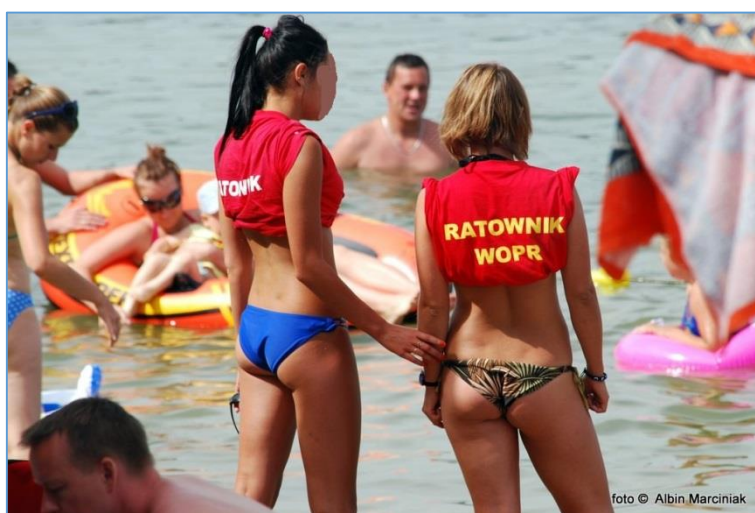
Ryc. 2. Ratowniczkę zbyt mocno eksponującą odkryte części ciała