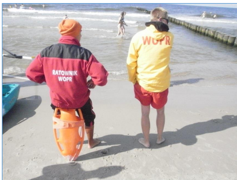
Ryc. 5. Ratownik traktujący sprzęt ratowniczy niezgodnie z przeznaczeniem

Godność, szacunek i sympatia a do tego poczucie bezpieczeństwa – ulokowane w jednej osobie, to zespół wartości, na które całe środowisko musi ciężko pracować. Wielu wspaniałych ratowników, traci przez wybryki kolegów, rzucających cień na całe środowisko.