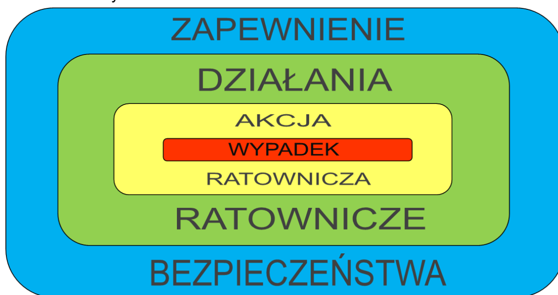
Ryc. 3. Zapewnienie bezpieczeństwa jako pojęcie szersze od działań ratowniczych

Zauważyć należy, że prawo nie pozwala na cesję obowiązku zapewnienia bezpieczeństwa , a jedynie na przekazanie części tego zadania, tj. działań ratowniczych.