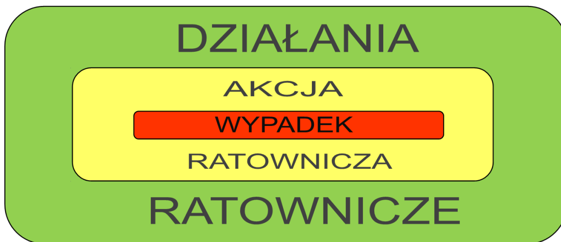
Ryc. 2. Działania ratownicze jako pojęcie szersze od akcji ratowniczej

Termin działania ratownicze pojawia się także w kolejnych artykułach (18-20) ustawy, np. w odniesieniu do: